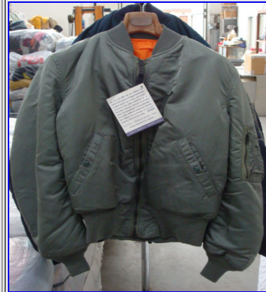
MA-1 Wool SS